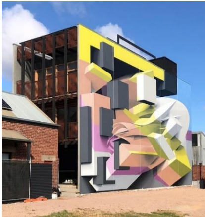
① Wonderwall Festival,ポートアデレード (豪) 2019