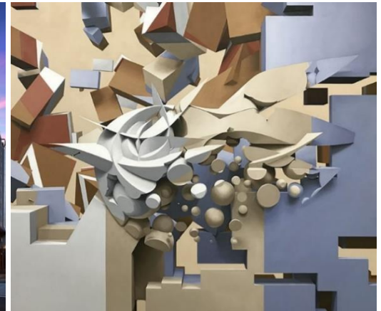
③ Bricks 130x110 cm,油絵, 2018