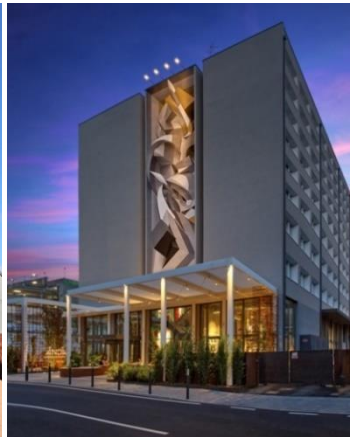
② Anda Hostel,ベネチア (伊) 2018