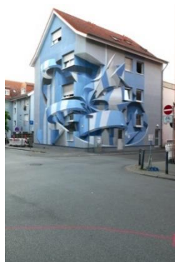
④ Stadt Wand Kunst, マンハイム (独) 2019