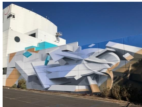
⑤ The Big Picture Festival,フランクストン (豪) , 2019