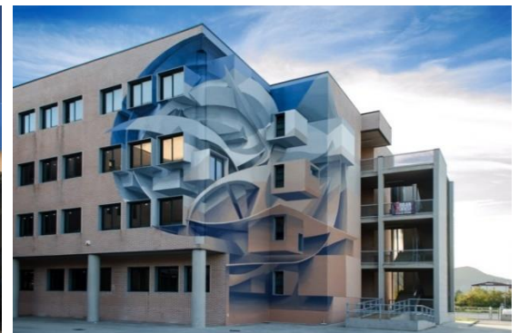
⑥ Liceo Gatto,アグロポリ (伊) , 2017

上記のほか、 ・ MURO FESTIVAL (ポルトガル・リスボン) ・ HOTEL ALMANAC (スペイン・バルセロナ) ・ JARDIN D'ORANGE (中国・深圳) など、世界各地で活動。